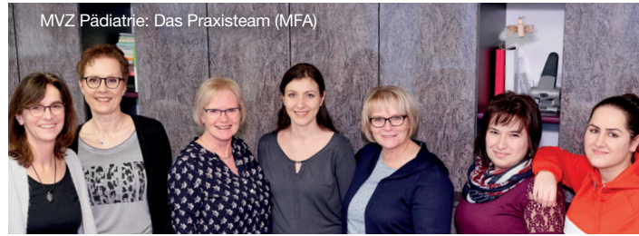
MVZ Pädiatrie: Das Praxisteam (MFA)

Fachärztin für Kinder- und Jugendmedizin, Pädiatrische Diabetologin (DDG)